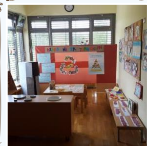
Kotiček o hrani- razni članki, recepti, plakati, izdelki otrok, ...