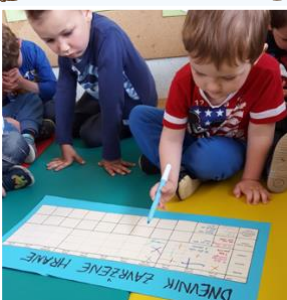
Dnevnik zavržene hrane (merjenje hrane)