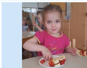
Hrana malo drugače, raznoliki načini priprave obrokov