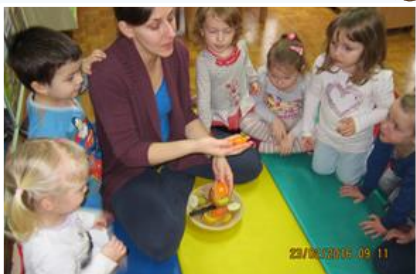
Spoznavanje hrane, preko tipanja, vonjanja, okušanja, opazovanja